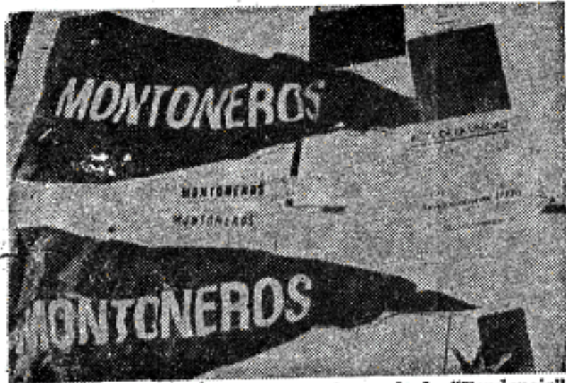
Además de insignias de agrupaciones de la "Tendencia", Areta tenía pólvora, material para fabricar bombas y planos.