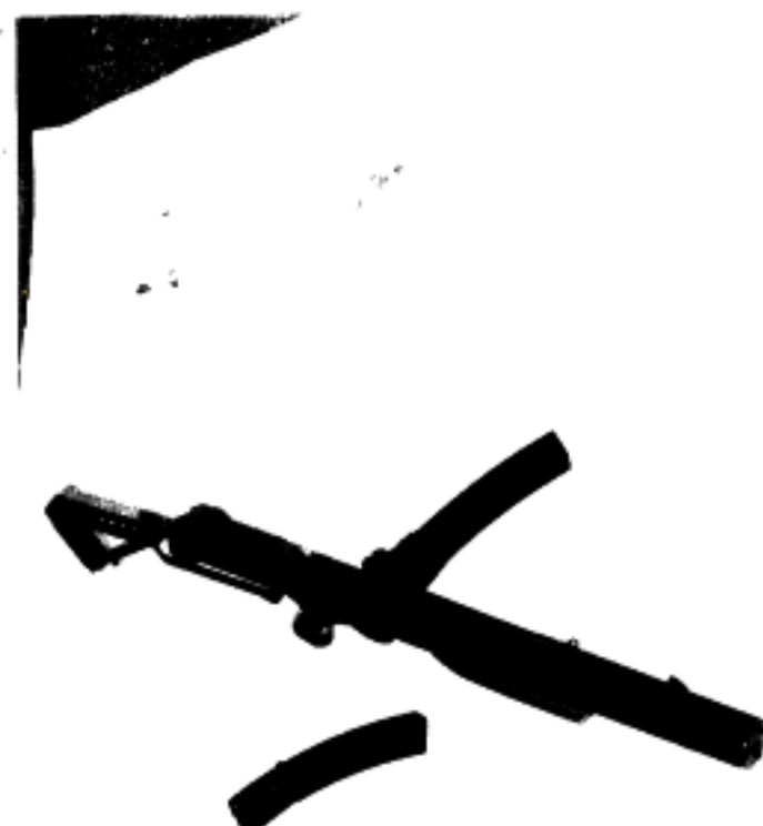
AMETRALLADORA " STERLING "