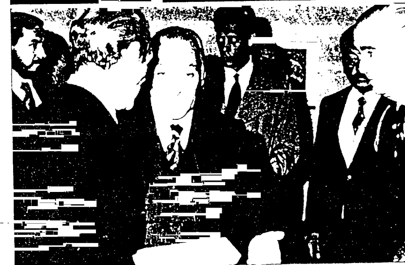
1975: Rodolfo Eduardo Almirón en Madrid Protegiendo al «brujo» López Rega