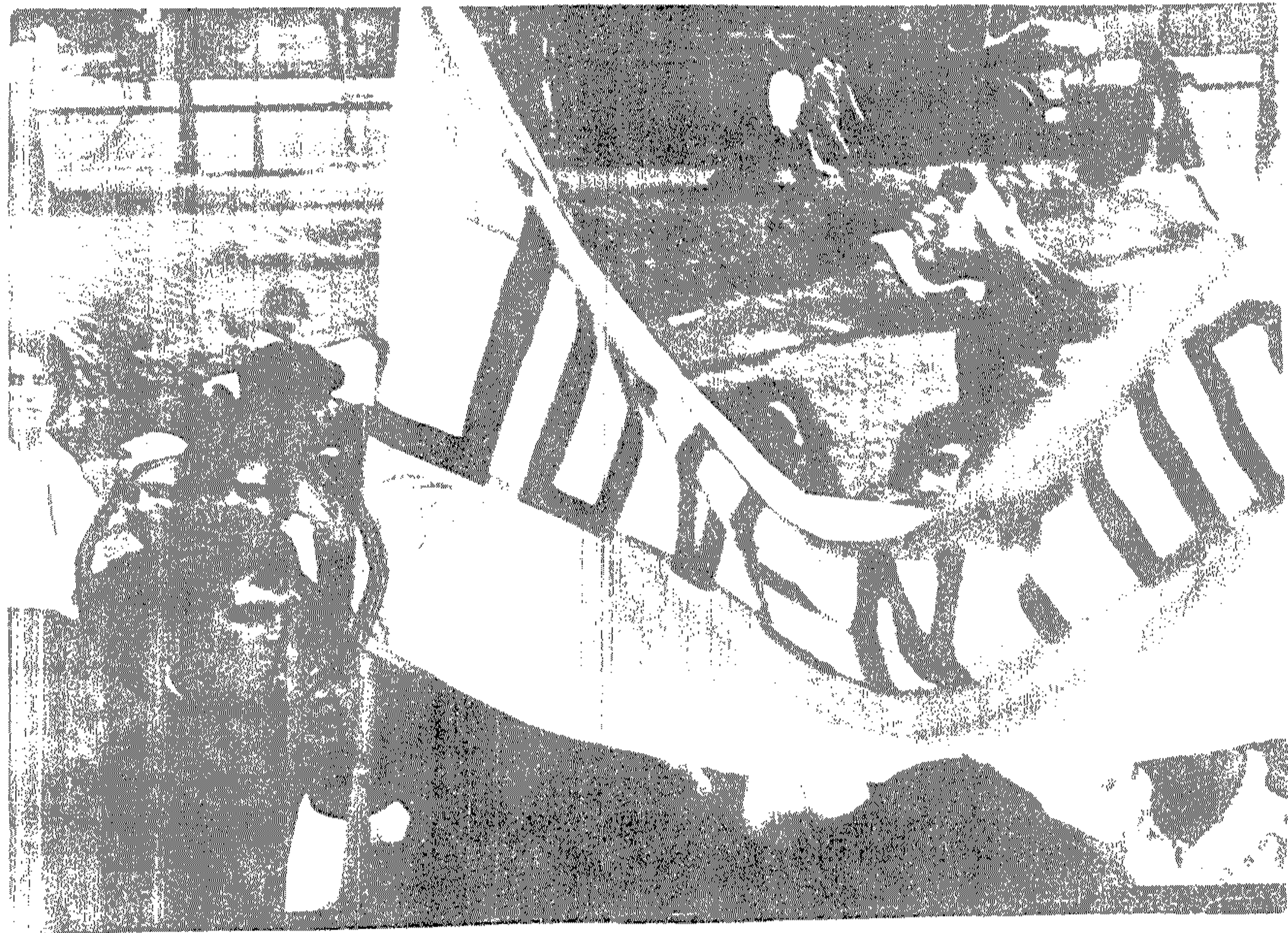
En la imagen se observa el momento de la inauguración de la Facultad de Ingeniería de Alimentos, durante la cual se realiza una ceremonia de inauguración.