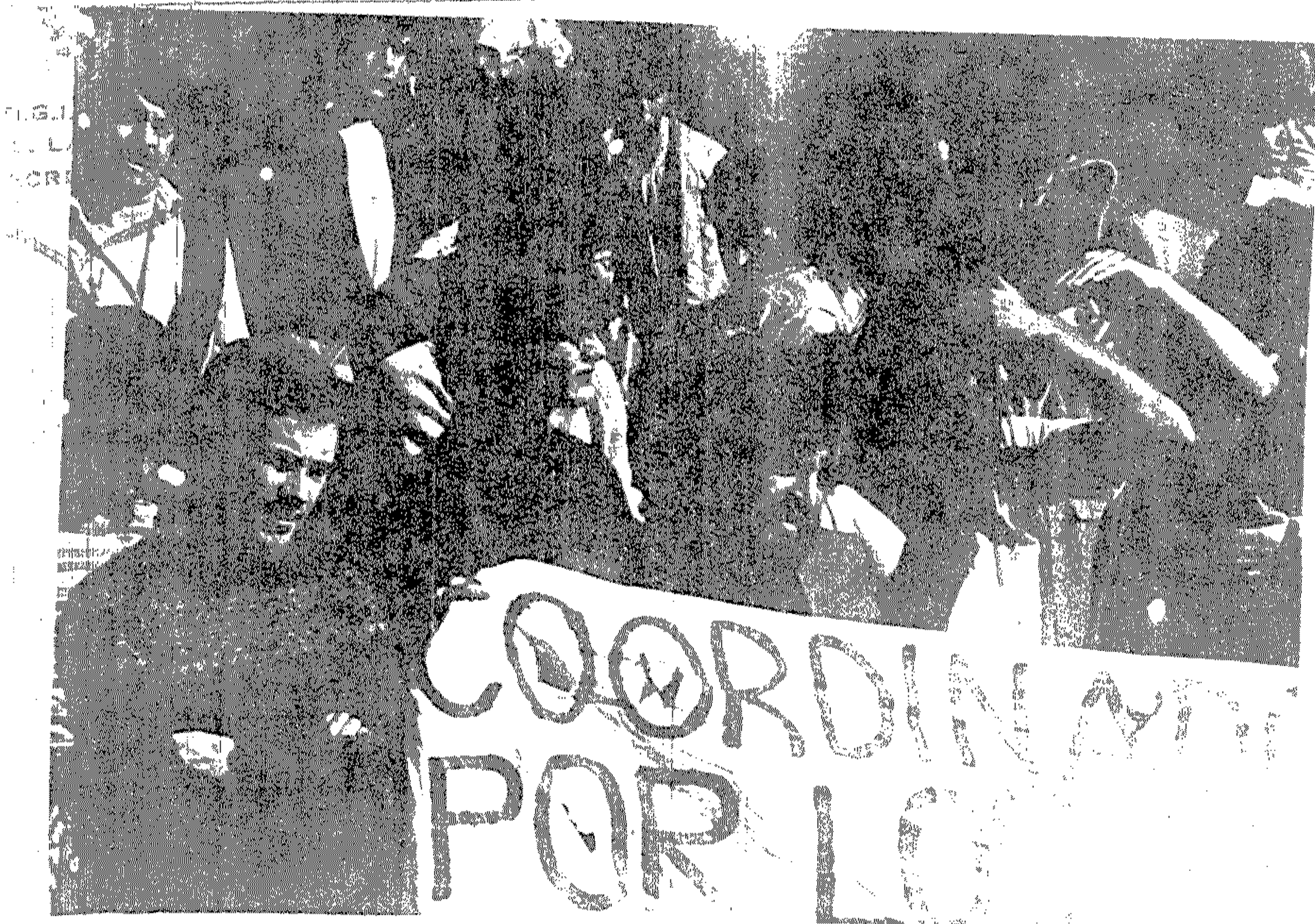
Otra toma en primer plano con una de las pancartas de la Coordinadora Estudiantil por los Derechos Humanos. Se observa en la fecha un trazo de la pancarta que muestra el nombre de la