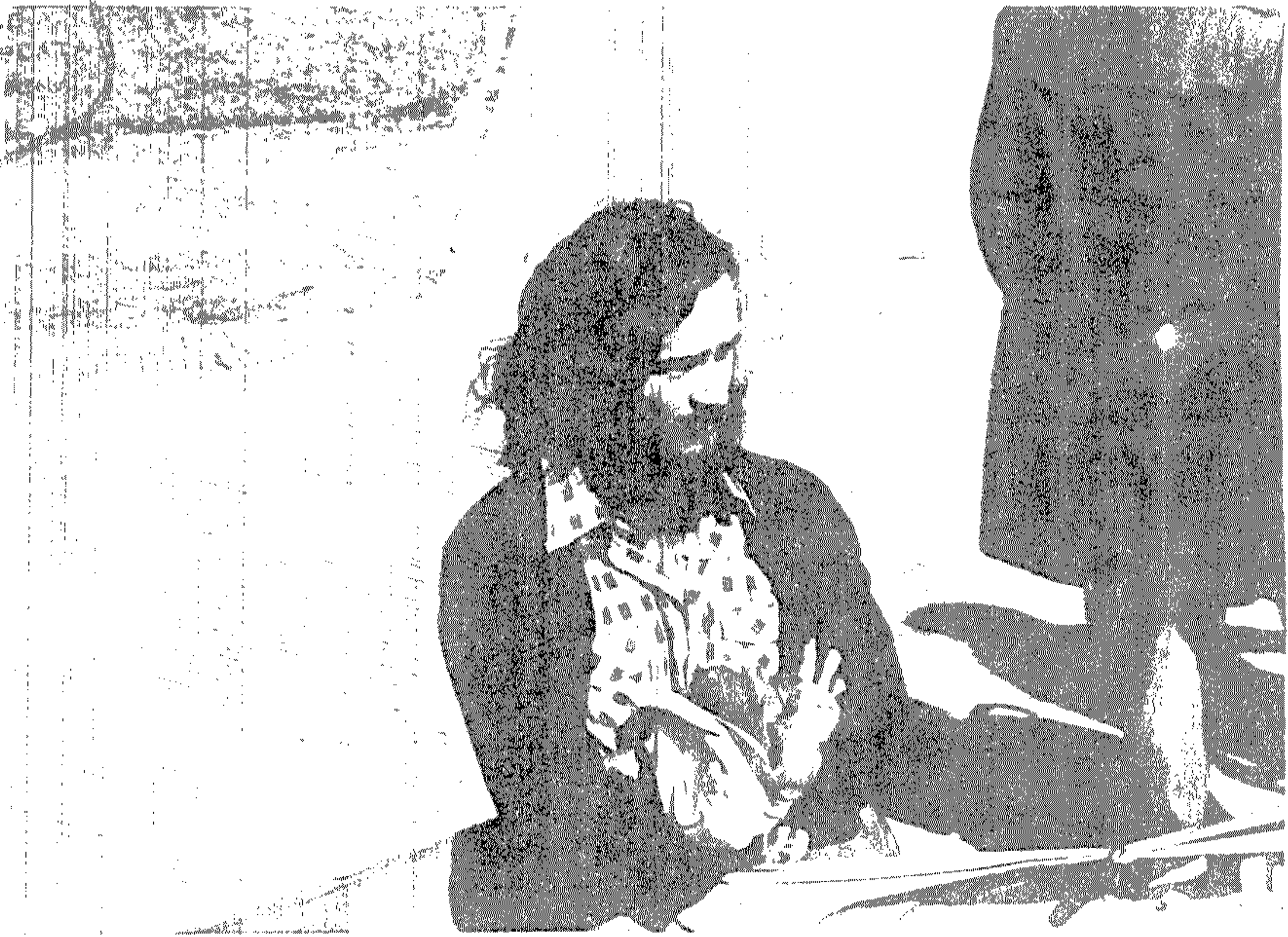
En el primer plano se observa una alumna de la carrera de Ingeniería de Alimentos de la Facultad de Ingeniería, mientras realiza un trabajo práctico en el laboratorio de Alimentos.