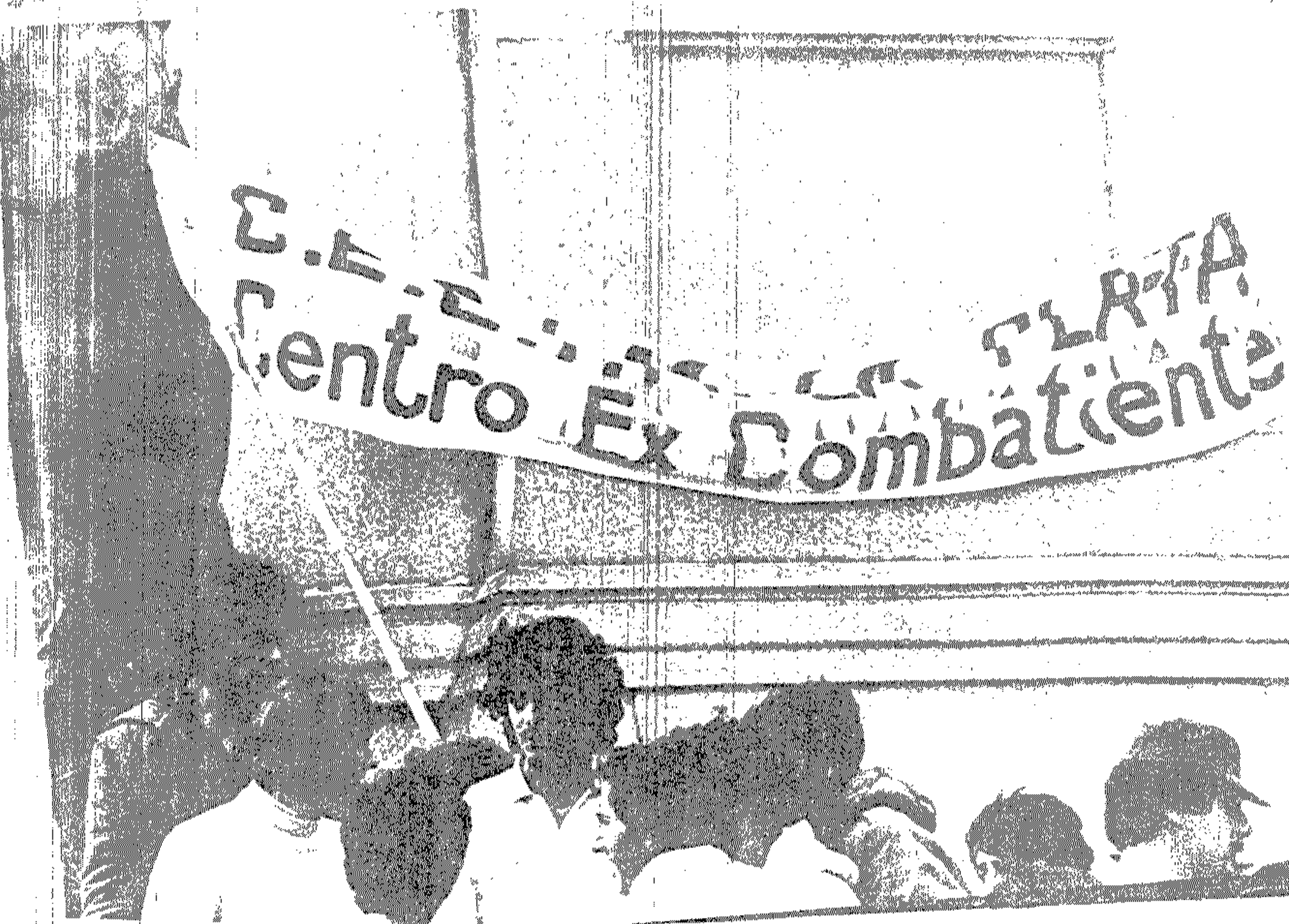
Se observa en un primer plano un pancarte con mensaje ante el UDELAR y algunos de sus integrantes.-