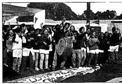
Con un bombo, los alumnos se manifiestan sobre la Av. Calchaquí.

Ante la insistencia de la prensa, las autoridades del colegio se negaron a hacer declaraciones sobre estos temas. La concentración produjo serios trastornos a los automovilistas.