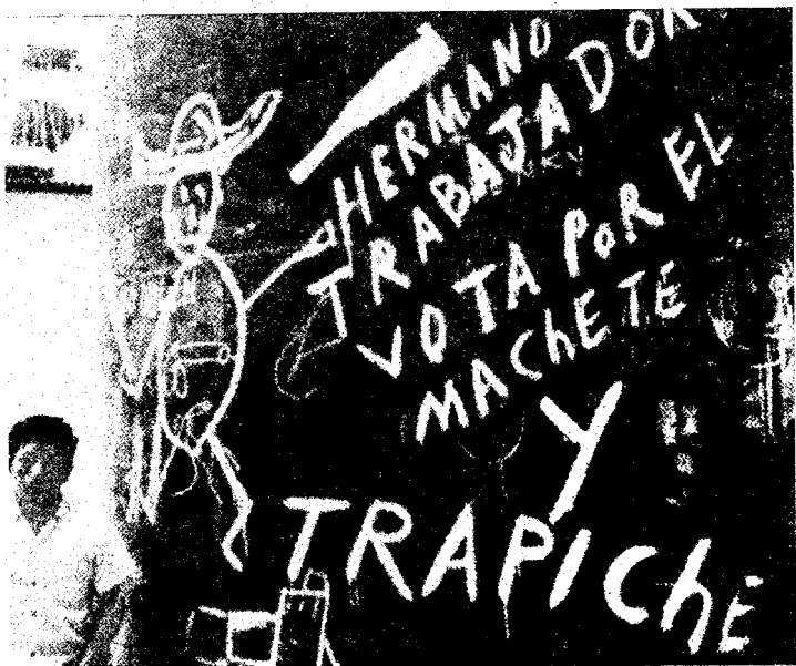
En Perú como en Argentina, las paredes reciben y transmiten el mensaje revolucionario de los pueblos.

El gobierno revolucionario de la Fuerza Armada del Perú acaba de promulgar días pasados, la ley que regula la creación y funcionamiento de las Empresas de Propiedad Social. Esta constituye uno de los peldaños más altos en la escala ascendente de la participación del pueblo peruano en la dirección de sus propios destinos, meta señalada desde los inicios de su revolución.