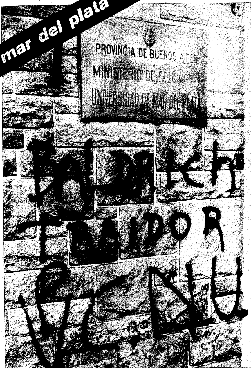
Los del CNU acusan al ministro de Educación de la provincia de Buenos Aires. "Traidor a Perón" lo han bautizado.

puja entre los que responden a Miguel y los que responden a la línea ruccista ya estaba desatada hacía tiempo.