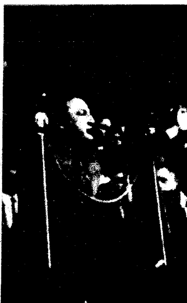
Haya de la Torre cuando era un líder popular (setiembre de 1933, en el mitin de Acho).

de la co-gestión y de la dirección de las empresas, donde la diferencia es más notoria. En Chile no llegó a implementarse la participación en la pequeña y mediana industria, con lo que no sólo no se incorporaron eficazmente sus trabajadores, sino que los empresarios fueron ganados en bloque por la reacción derechista. Además, la dirección de las empresas estatales llama-