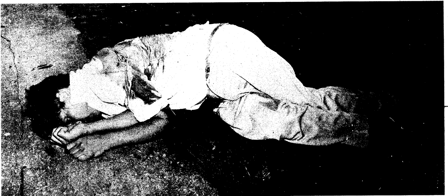
Su último acto político público fue la misa por Chejolan.

Ahora, en el momento de la reflexión, es preciso rectificar los errores y construir la unidad del pueblo.