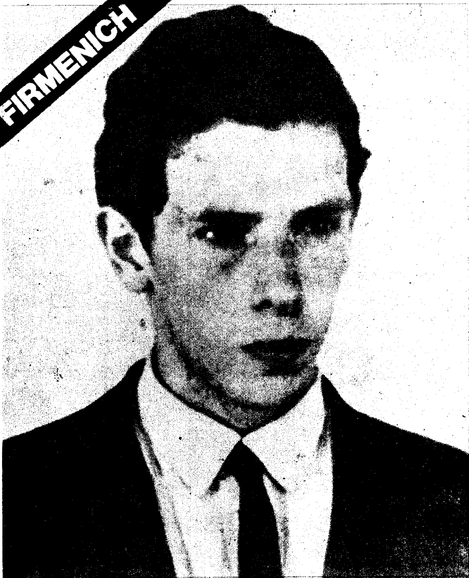
Fernando Abal Medina: la asunción concreta de la lucha armada marcó la primer diferencia con Mugica.