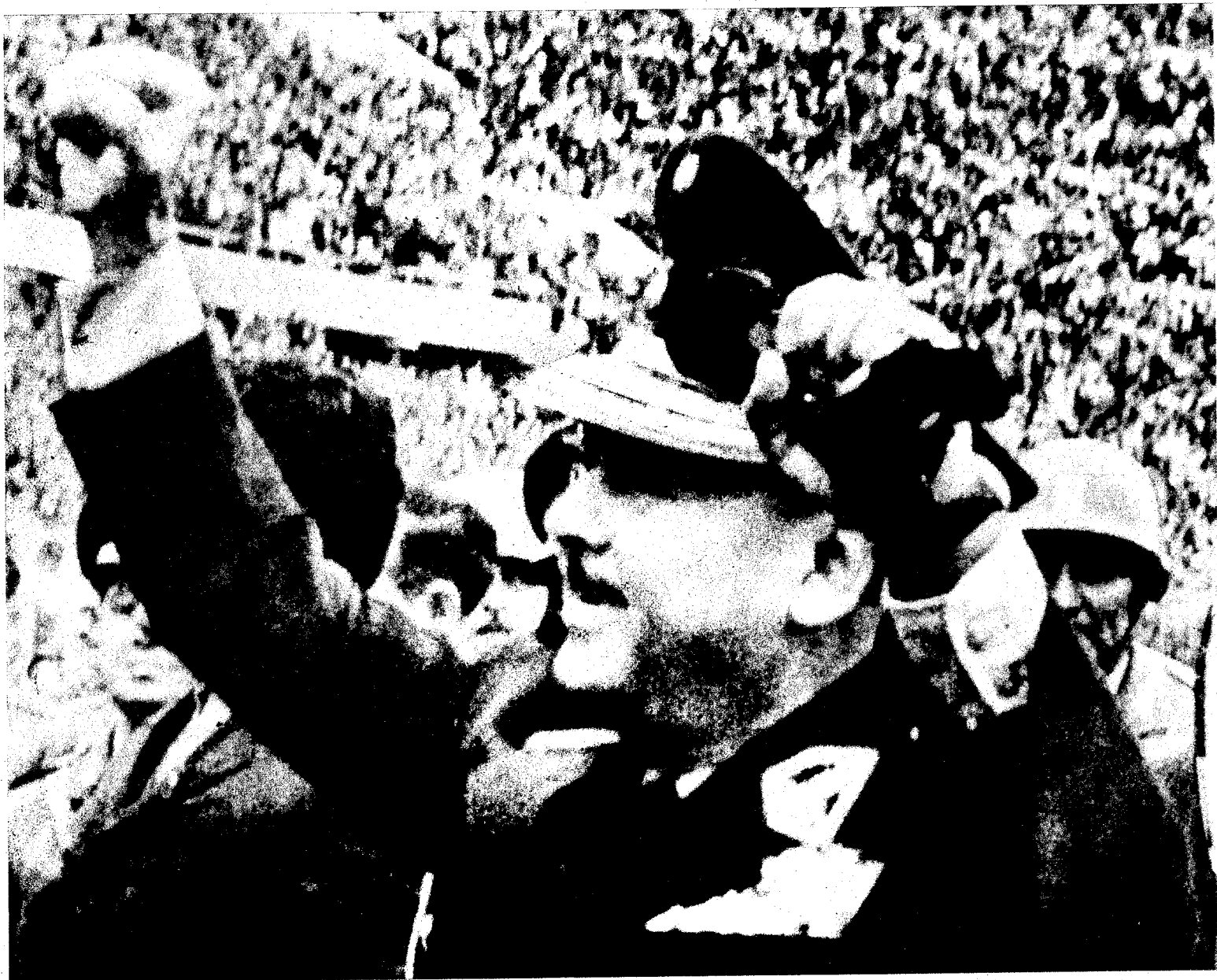
El jefe de la revolución saluda al pueblo como siglos atrás lo hiciera el rebelde Tupac Amará.