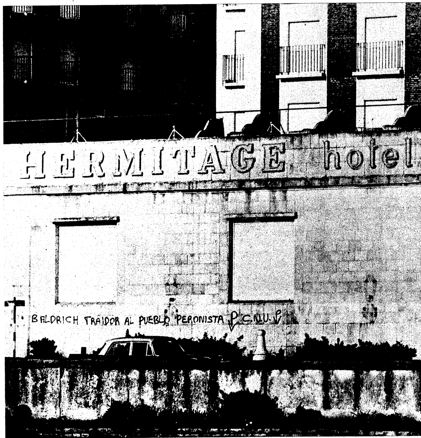
El Hermitage, un bacán marplatense que también sirve de mural a las huestes del CNU. Los discípulos de Giovenco están enojados.

¿En qué negocio andarán los burócratas de la CGT marplatense? Mientras tanto, la ciudad feliz está bajo la protección del CNU, Alianza y Comando de Organización.