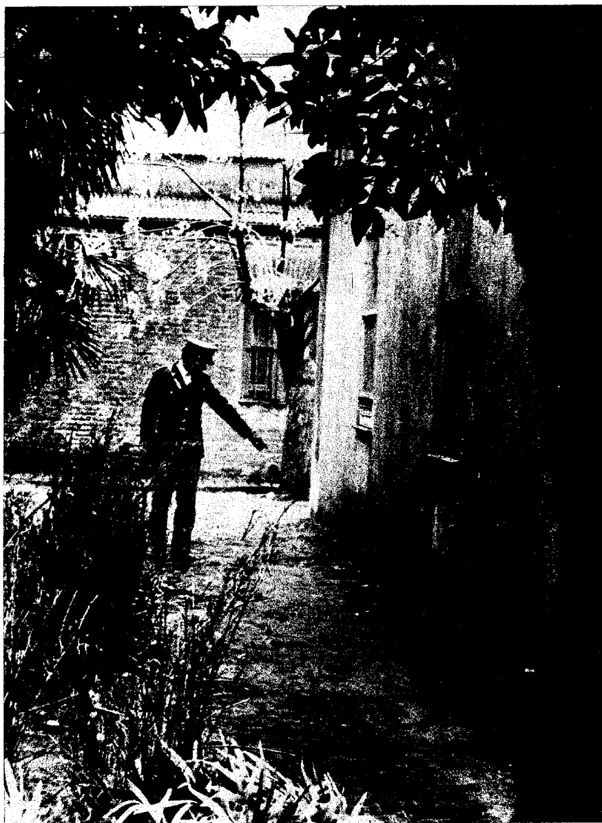
Aquí, en Timote, el pueblo aplicó su justicia.

oligarquía, y cuanto más débil sea la política interior, más rápida y segura será nuestra derrota.