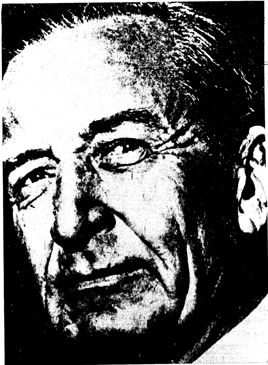
Mugica se jugó defendiendo a los Montoneros después del aramburazo.

"(...) Son los compañeros que alzaron la vista y comprendieron el 1º de mayo que la conducción estratégica del Movimiento era sólo Perón y que el proyecto Montonero era una aventura alucinante de quienes reventaron a Mugica y luego, al más puro estilo gangsteril le enviaron una corona. Como queriendo confundir y engañar."