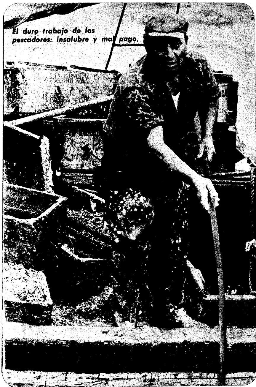
El duro trabajo de los pescadores: insalubre y mal pago.