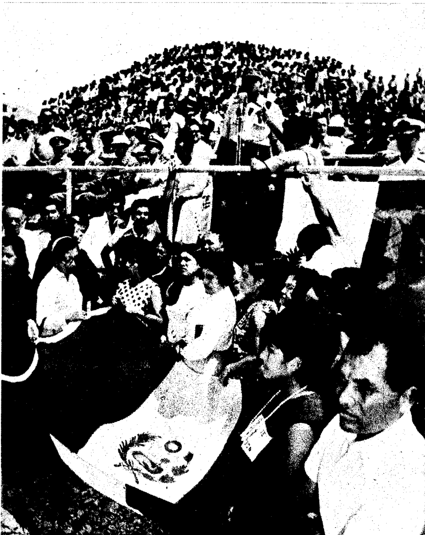
Militares dialogando con su pueblo, sin vergüenza, sin custodias, sin intermediarios ni paternalismos esterilizantes.

obreros en forma permanente, está obligado a compartir la dirección de la empresa y de las utilidades con sus trabajadores, pero al mismo tiempo se asegura que su aporte al proceso de cambios y un lugar en el camino hacia la sociedad socialista.