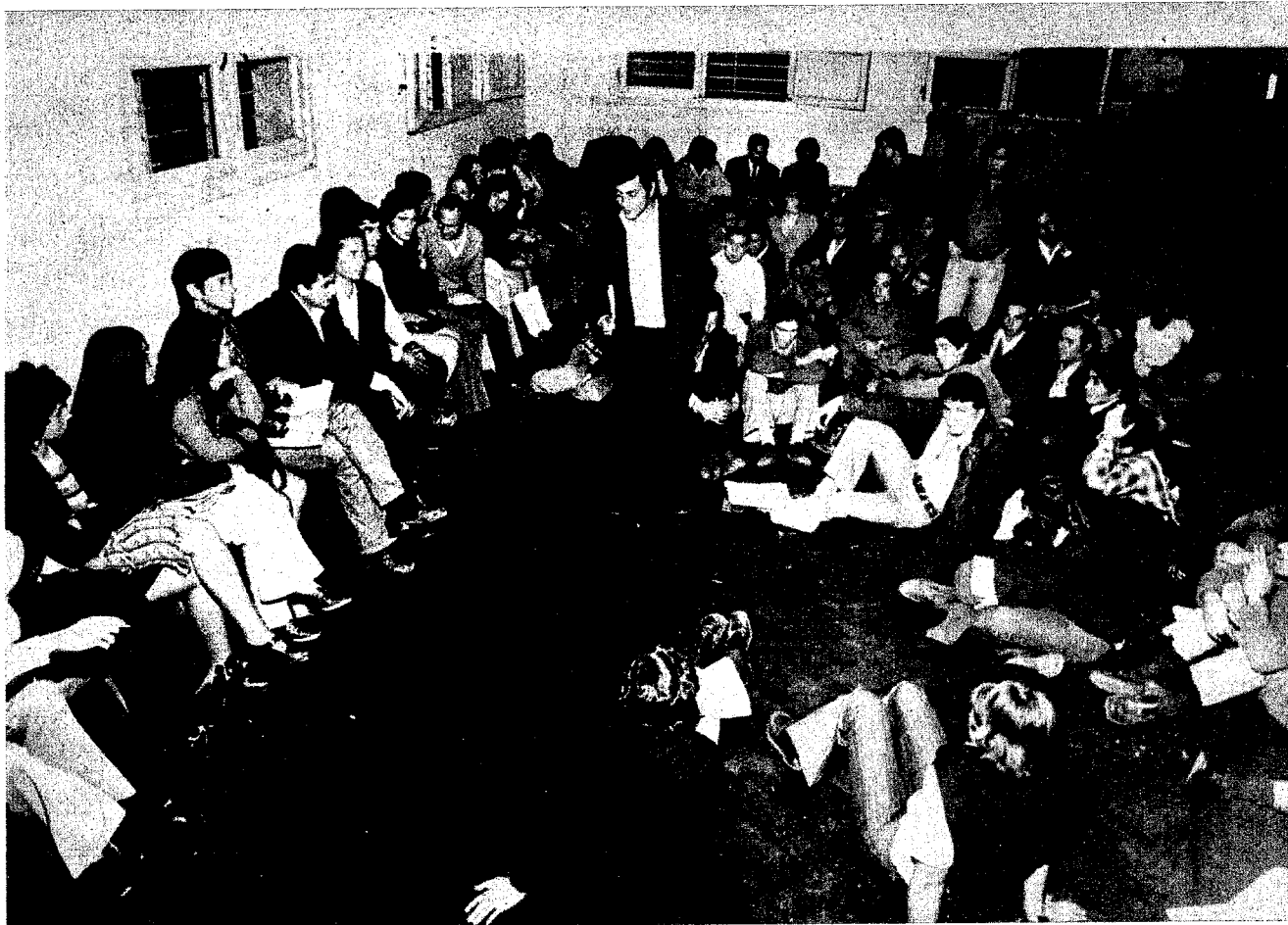
Asamblea del sábado 17: "Hasta que no estén todos en libertad, nadie entra a la fábrica."

La empresa denuncia la medida de fuerza. La delegación