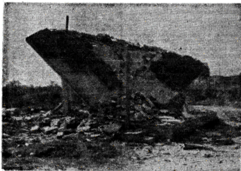
Esto es lo que quedó del destacamento copado y volado por comandos de la FAR en la zona del Dock Sud.

La Policía Federal, con la colaboración de efectivos provinciales y miembros de las fuerzas de seguridad, buscan intensamente a los guerrilleros pertenecientes a la organización FAR "Comando Pablo Mestre", que en un operativo comando asaltaron el destacamento de la Prefectura Nacional Argentina ubicado en el muelle de inflamables, en Dock Sud. Como ya hemos informado, tres mujeres y cuatro hombres tomaron de improviso el lugar y dominaron a