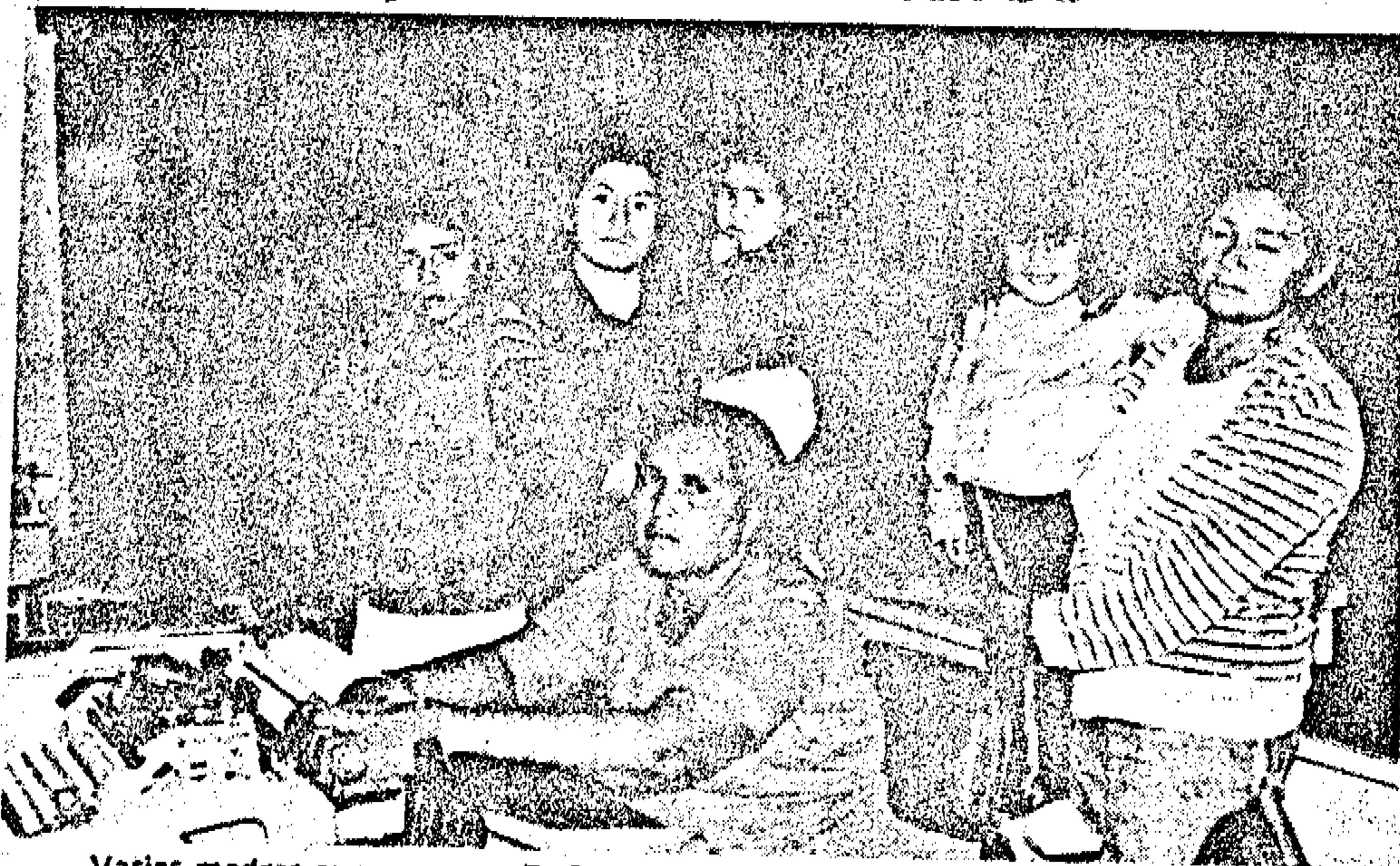
Varias madres expresaron a El Sol sus inquietudes sobre el actual funcionamiento de la Casa del Niño que se encuentra en San Francisco Solano.