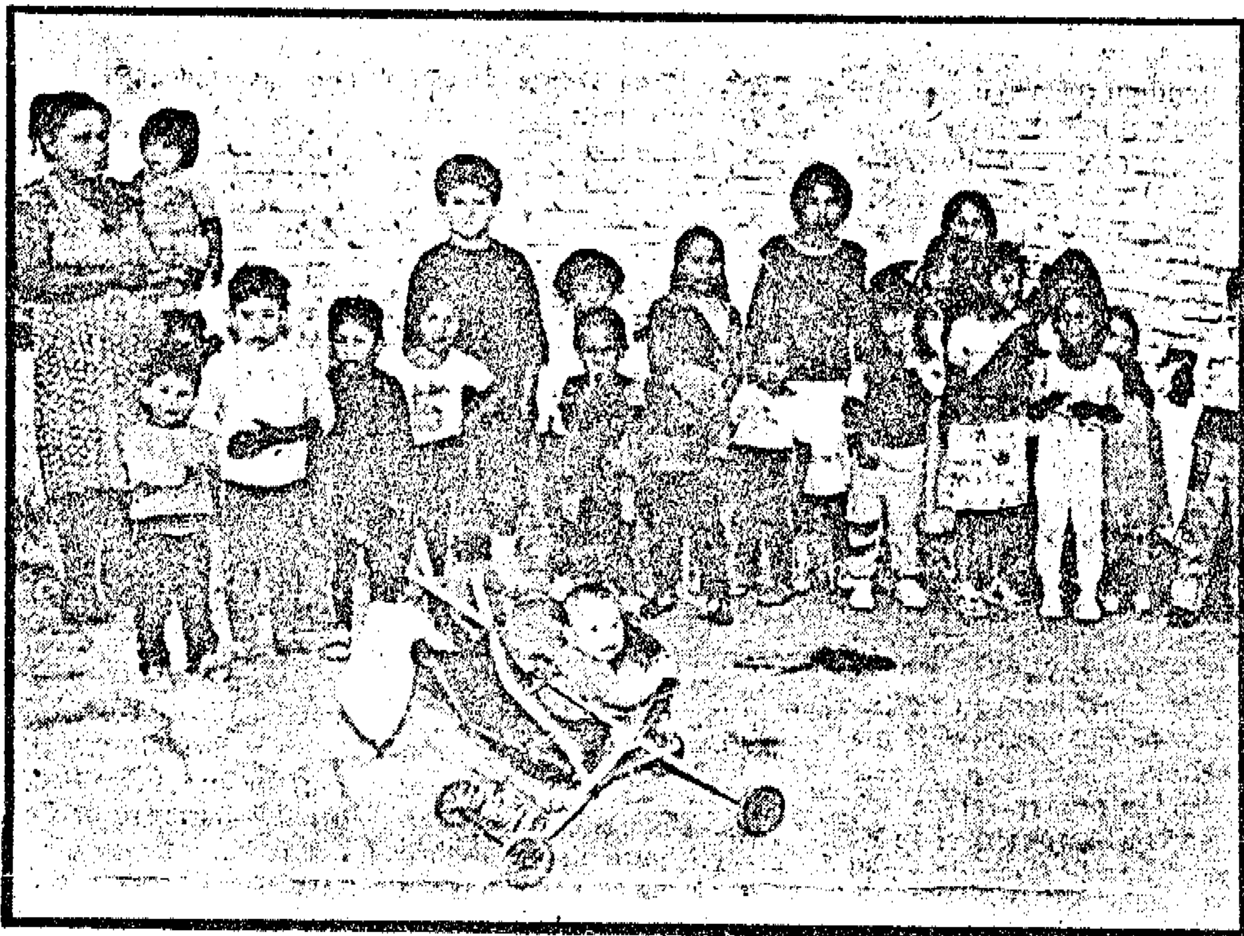
Algunos de los niños que concurren al comedor de UMA.

Más adelante se manifiesta que el trámite, anteriormente mencionado, fue derivado "a la Dirección de la Minoridad de La Plata, iniciado por U.M.A. conjuntamente con la Sociedad de Fomento 1ro de Mayo (EXPE-DIENTE número 28020858) el 27/9/84 para la construcción, ya que la sede de la Sociedad de Fomento en donde funcionamos contaba solamente con el tercero y una piccota de 3 por 3 metros cuadrados, en base al plano solicitado por Minori-